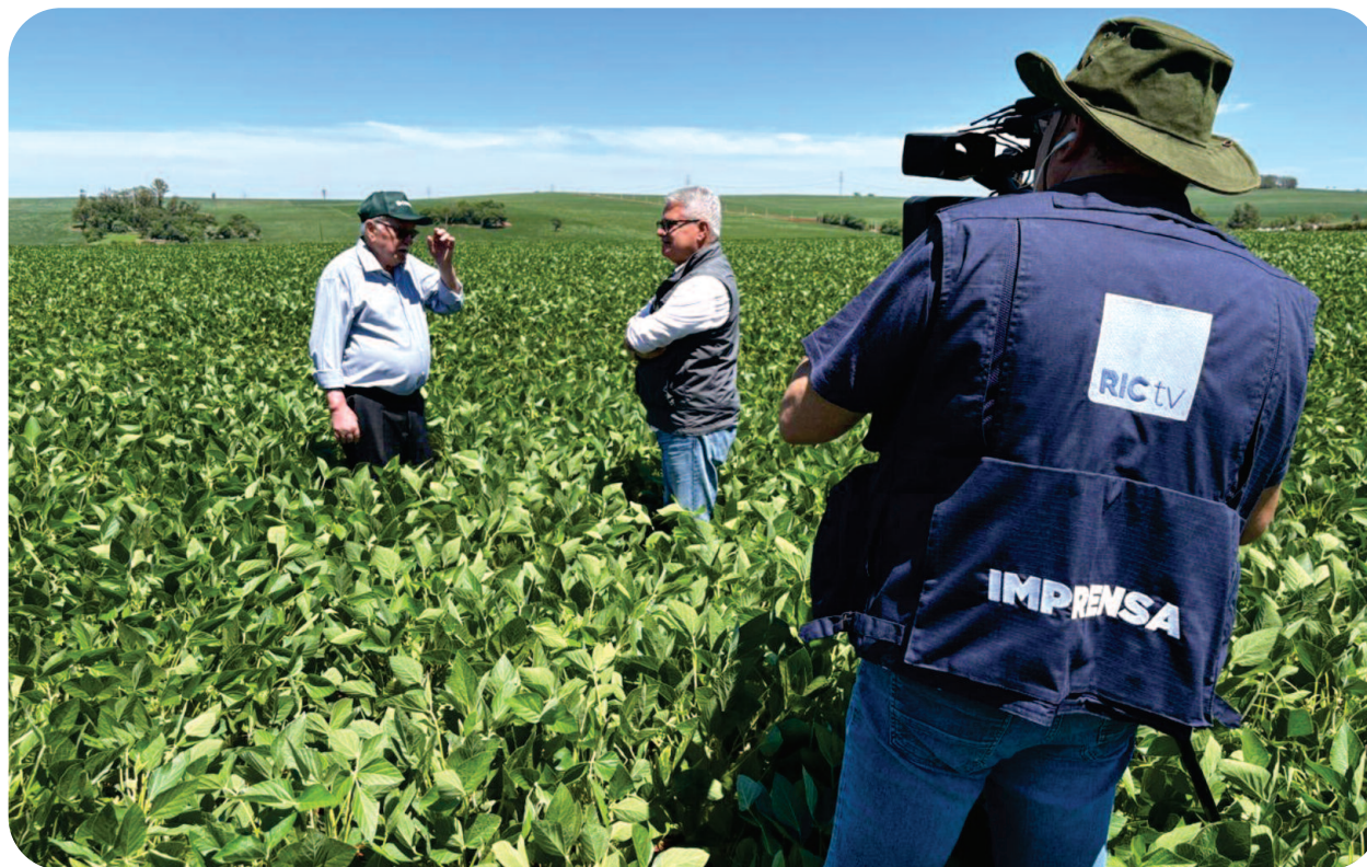
A visita do Rally foi acompanhada pela equipe do programa RIC Rural